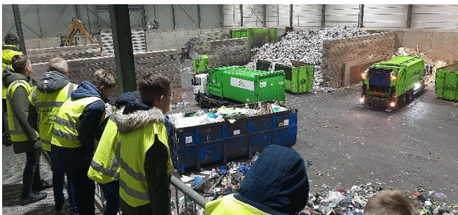
Groep 8 op bezoek bij de ROVA